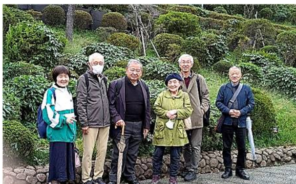
【魔法の文学館の前】