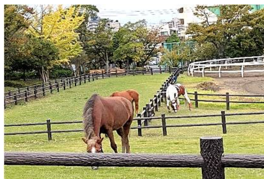
【隣のポニーランド】